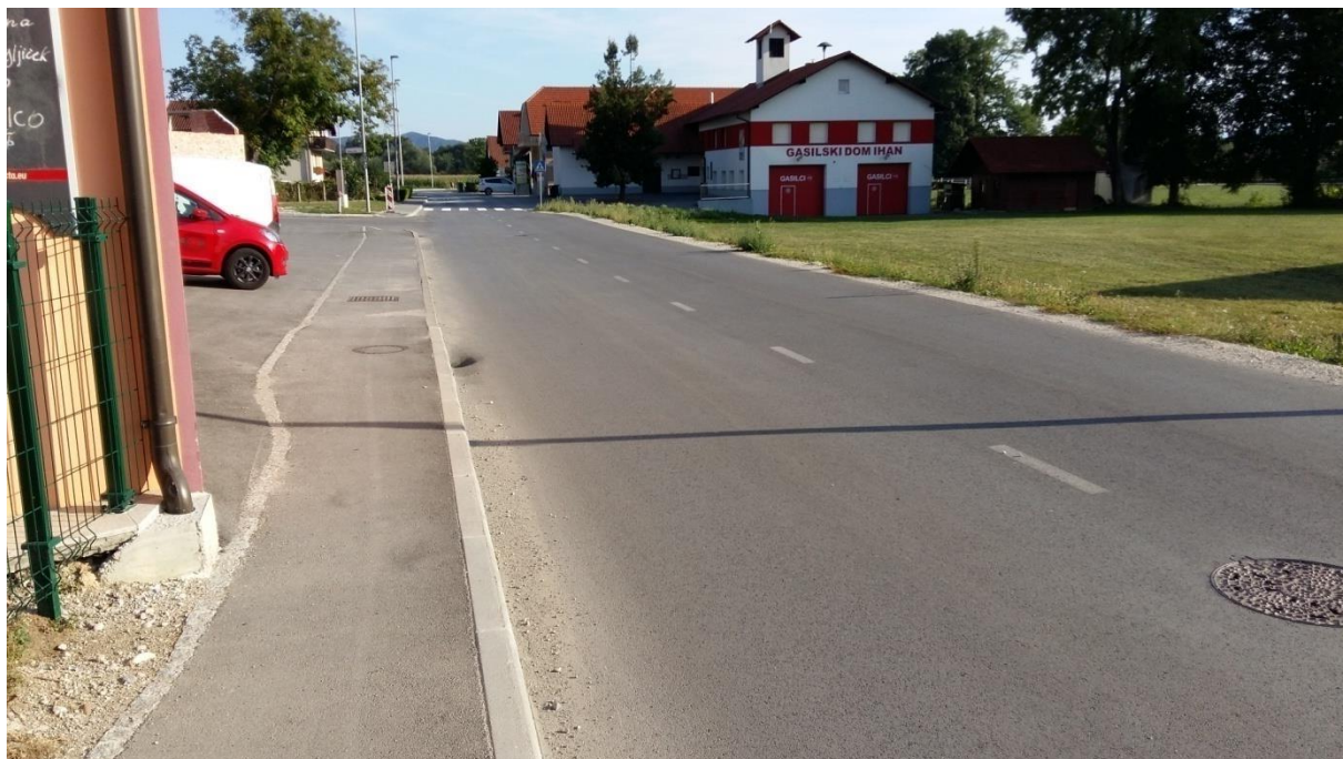
Slika 3: Pločnik pri Piceriji Dante Šolar naj bo pozoren na avtomobile, ki so parkirani pred picerijo. V tem delu odsvetujemo pot v šolo.