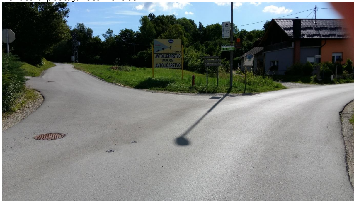
Slika 6: Postajališče Goričica pri Ihanu Postajališče je pregledno, cesta je brez pločnika. Šolar mora hoditi po levi strani roba cestišča. Cestišče lahko prečka šele takrat, ko je kombi že odpeljal. Preden prečka cestišče, naj upošteva pravila prečkanja in navodila šolar pešec (6.1.).