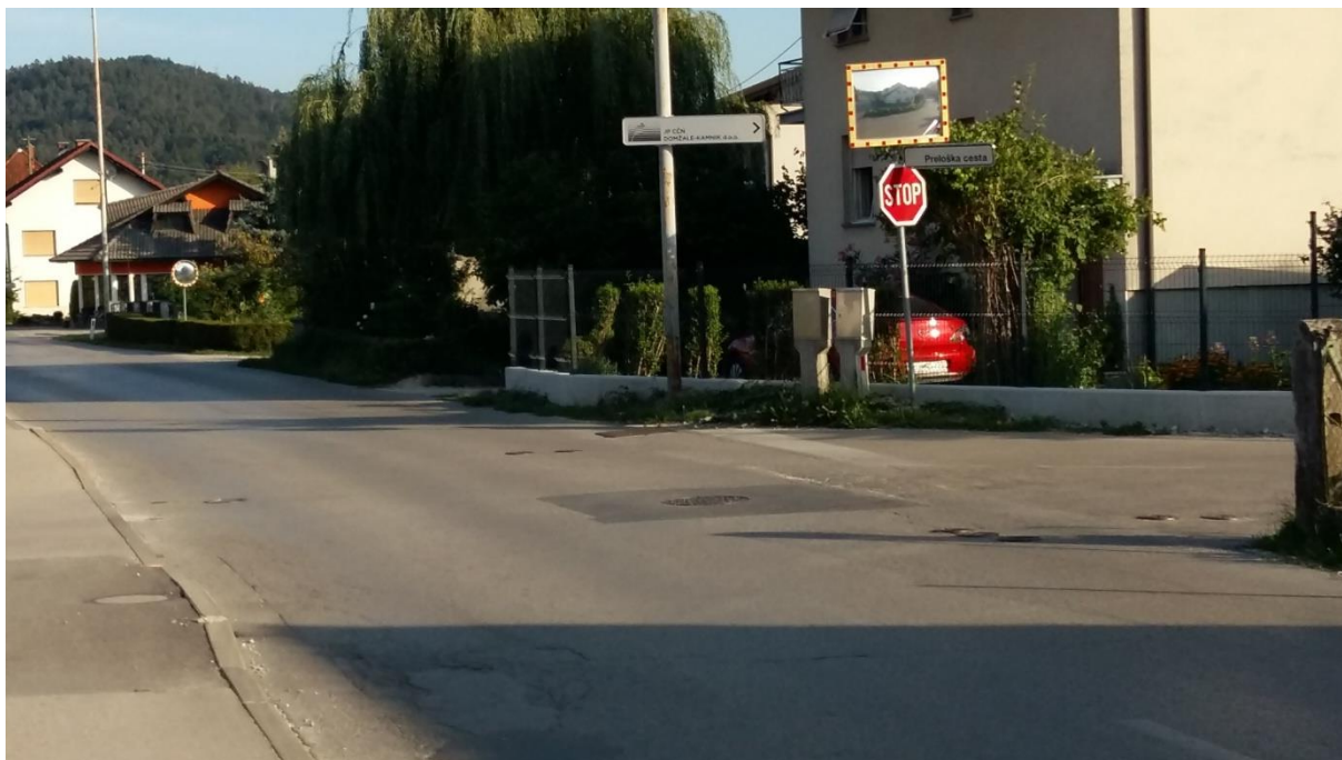
Slika5: Križišče z Breznikovo in Preloško cesto.

Po Preloški cesti se je v zadnjem času zgostil promet. Šolar naj hodi ob levem robu cestišča in naj bo pozoren pri prečkanju ceste, saj se iz Preloške ceste priključi na Breznikovo cesto. Preden prečka cestišče, naj upošteva pravila prečkanja in navodila šolar pešec (6.1.) ter šolar kolesar (6.2.).