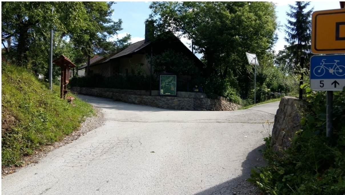
Slika 8: Postajališče v Dobovljah ni pregledno, cesta je brez pločnika. Šolar mora hoditi po levi strani roba cestišča.

Ko izstopa iz kombija, mora šolar počakati, da kombi odpelje in šele nato prične z varno hojo ali prečkanjem cestišča. Pri prečkanju upošteva pravila prečkanja in navodila šolar pešec (6.1.).