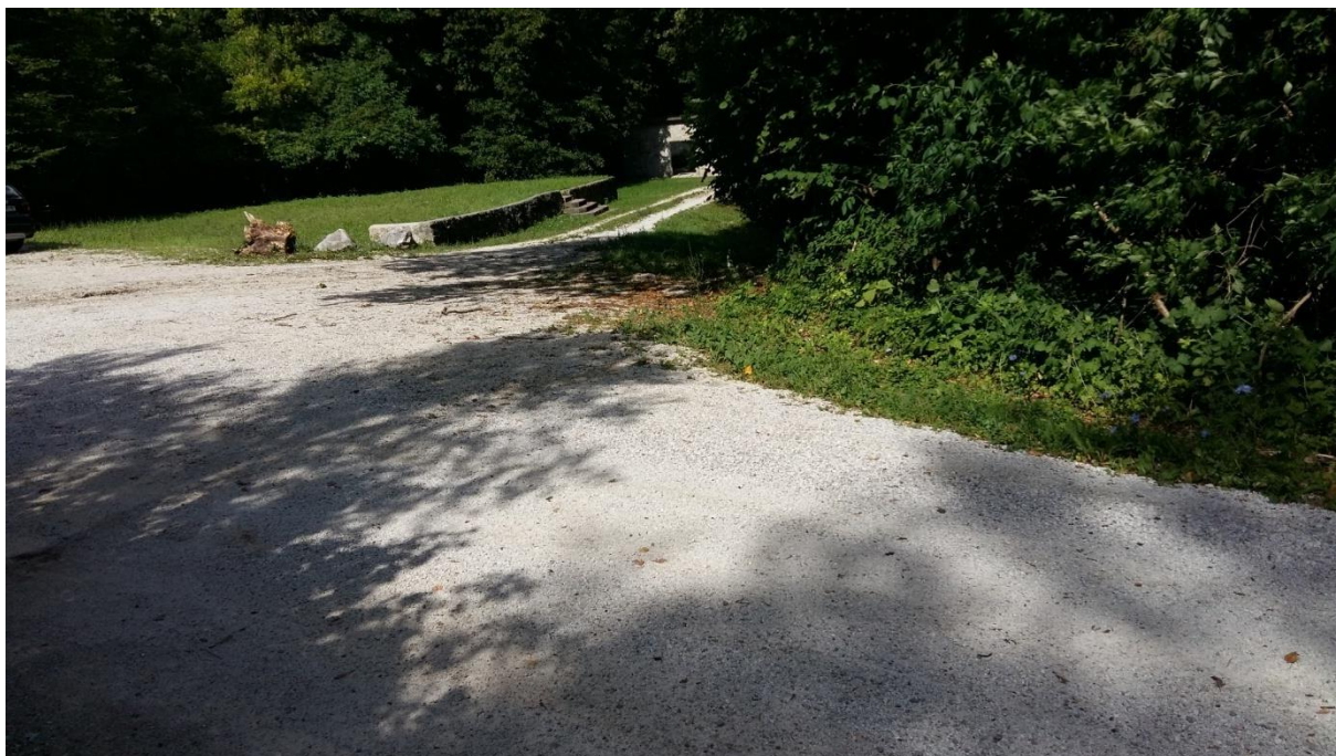
Slika 9: Postajališče na Oklu

Ko izstopa iz kombija, mora šolar počakati, da kombi odpelje in šele nato prične z varno hojo ali prečkanjem cestišča. Pri prečkanju upošteva pravila prečkanja in navodila šolar pešec (6.1.).