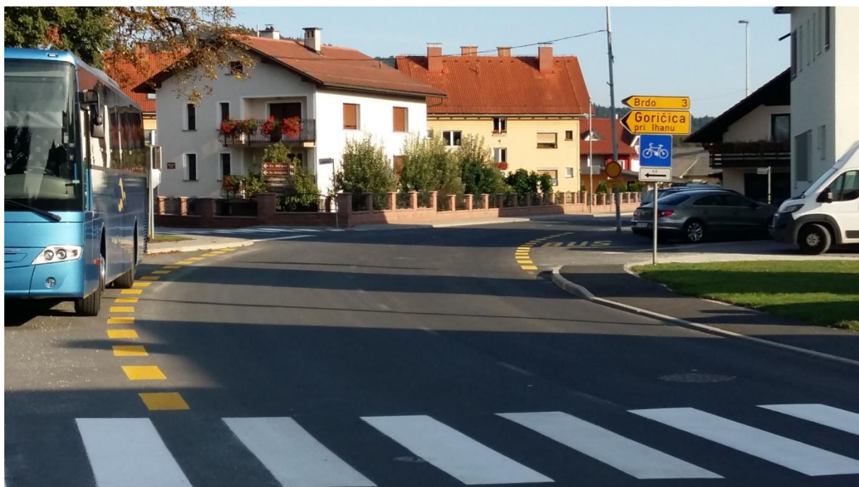
Slika 4: Križišče s Taborsko cesto in Breznikovo cesto Križišče je nepregledno, vendar je šolar v nevarnosti zaradi kršitve omejitve hitrosti. Pri prečkanju mora biti previden. Preden stopi na vozišče, naj preveri, da se je vozilo ustavilo in nato prečka cestišče.