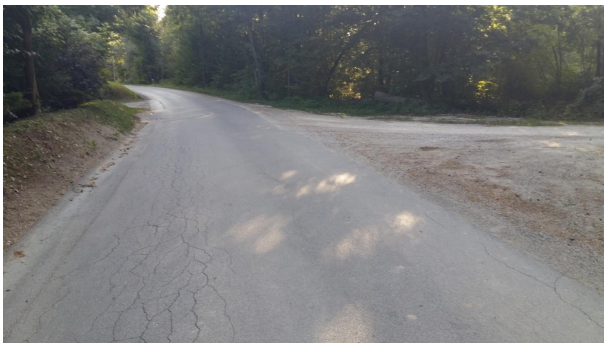
Slika 7: Postajališče je pregledno, cesta je brez pločnika. Šolar mora hoditi po levi strani roba cestišča. Cestišče lahko prečka šele takrat, ko je kombi že odpeljal. Preden prečka cestišče, naj upošteva pravila prečkanja in navodila šolar pešec (6.1.).