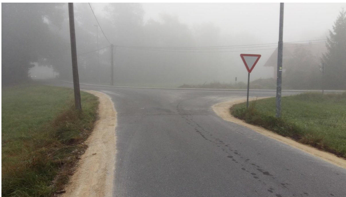
Slika 6: Križišče iz Bišč v Selu pri Ihanu

Po Preloški cesti se je v zadnjem času zgostil promet. Šolar naj hodi ob levem robu cestišča in naj bo pozoren pri prečkanju ceste, saj se iz Preloške ceste priključi na Breznikovo cesto. Preden prečka cestišče, naj upošteva pravila prečkanja in navodila šolar pešec (6.1.) ter šolar kolesar (6.2.).