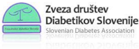
Logotip Zveze društev Diabetikov Slovenije

Ključne besede, kategorije: tekmovanje v znanju o sladkorni bolezni, projekt zdrava šola, zveza društev Diabetikov Slovenije, osnovna šola, 14. november