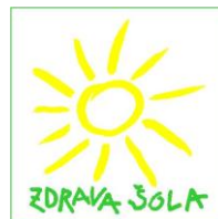
Logotip projekta Zdrave šole