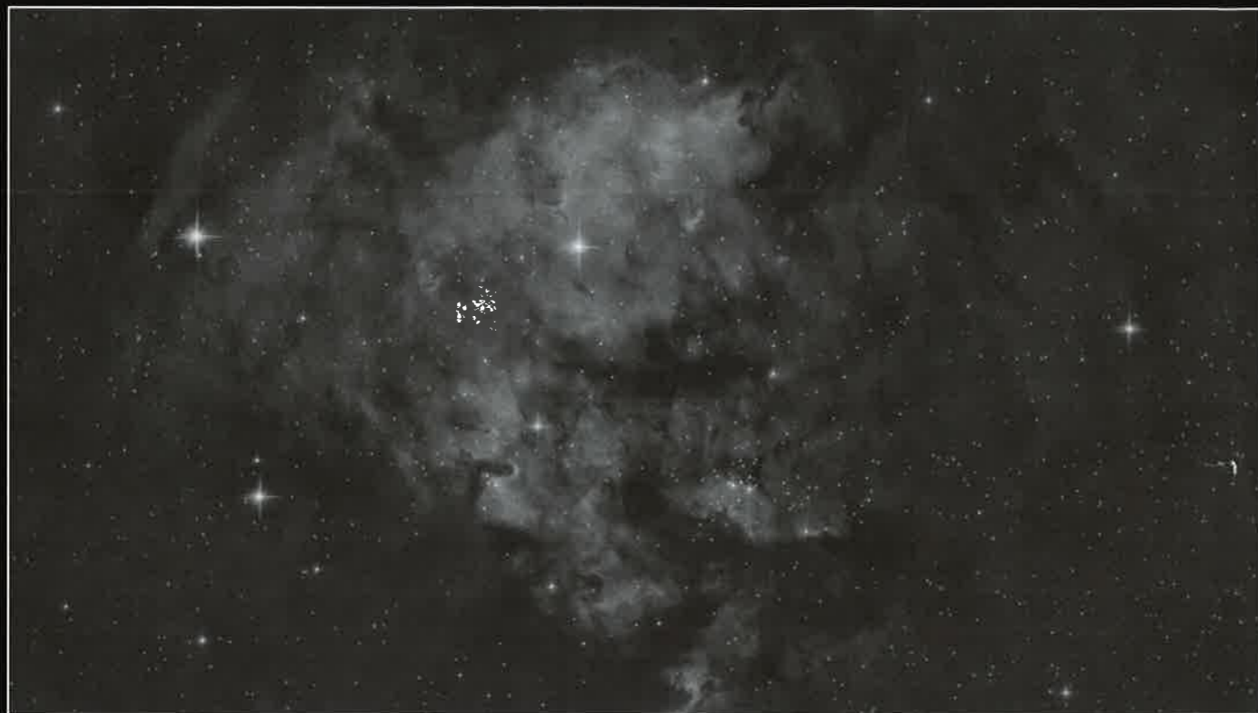
Meglica NGC 7822 v ozvezdju Kefeja