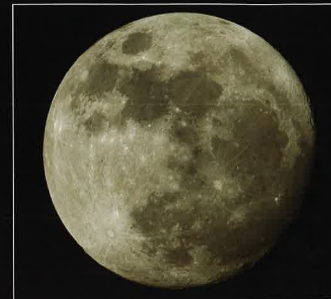
Slika zgoraj: Sonce v H-alfa svetlobi. Zgoraj desno: Skoraj polna Luna. Desno: Mars, Jupiter in Saturn. Spodaj: Meglica Orel (M 16) v ozvezdju Kače