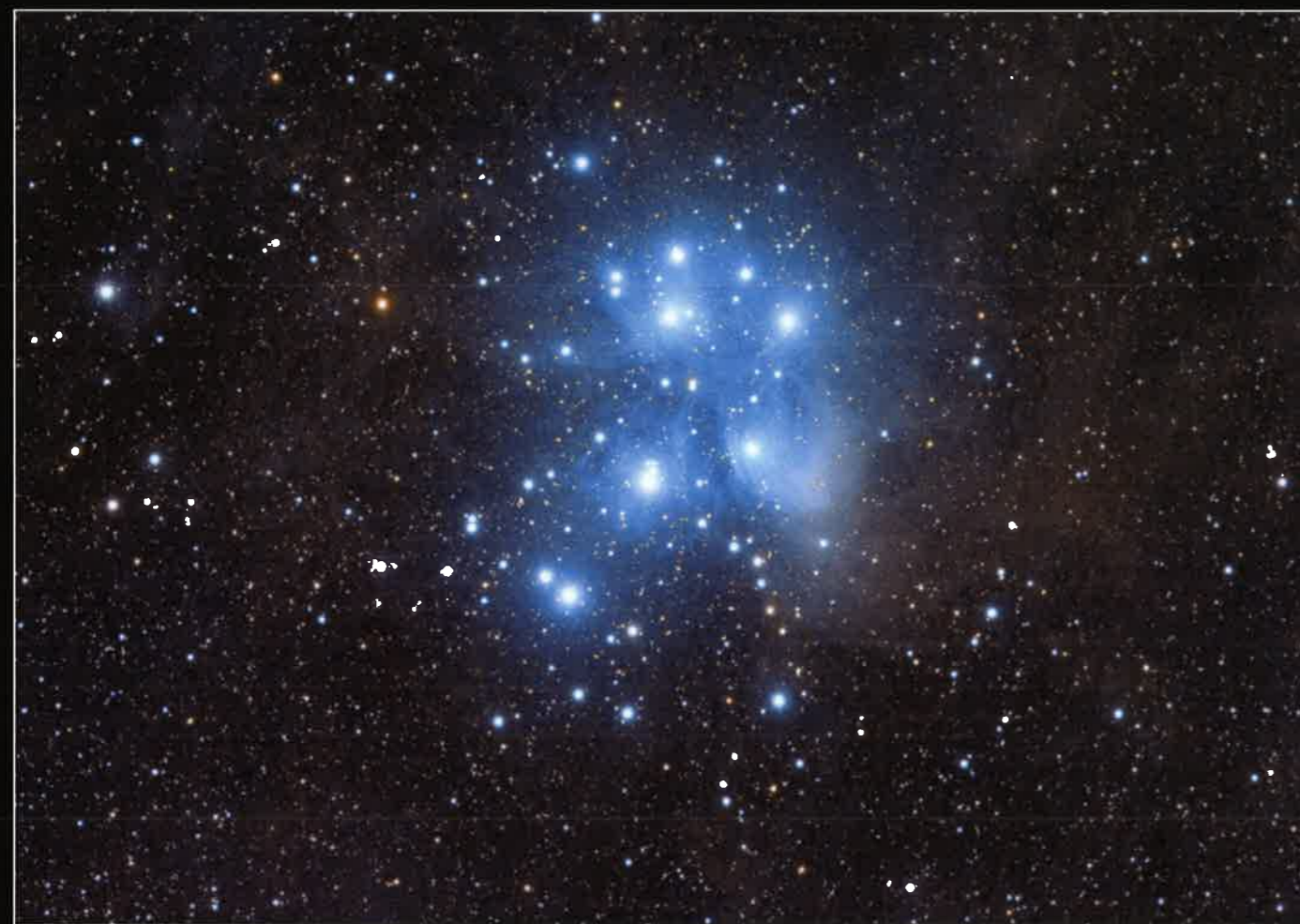
Razsuta kopica Plejade (M 45) v Biku