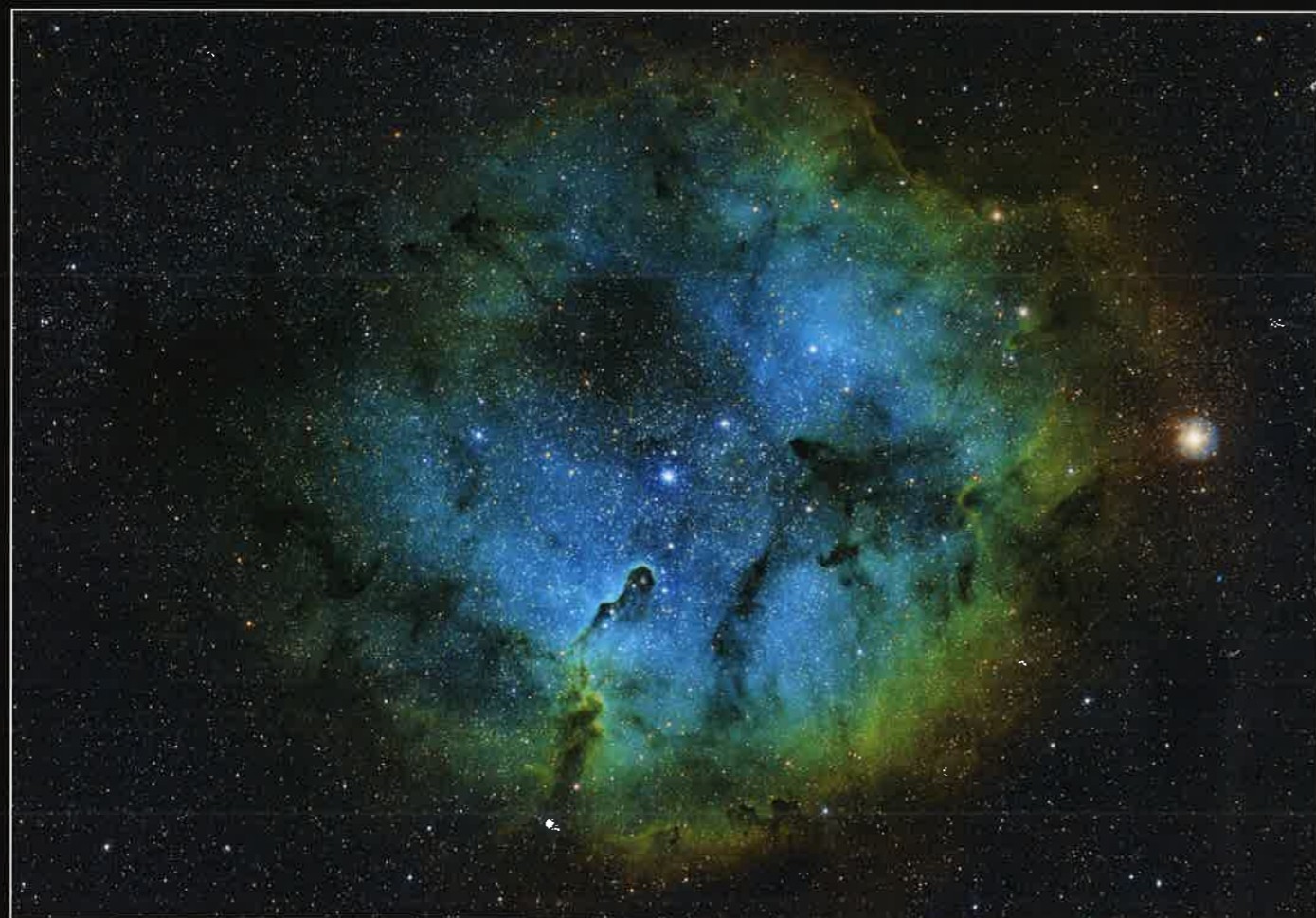
Širokokotni pogled na meglico IC 1396 v ozvezdju Kefeja